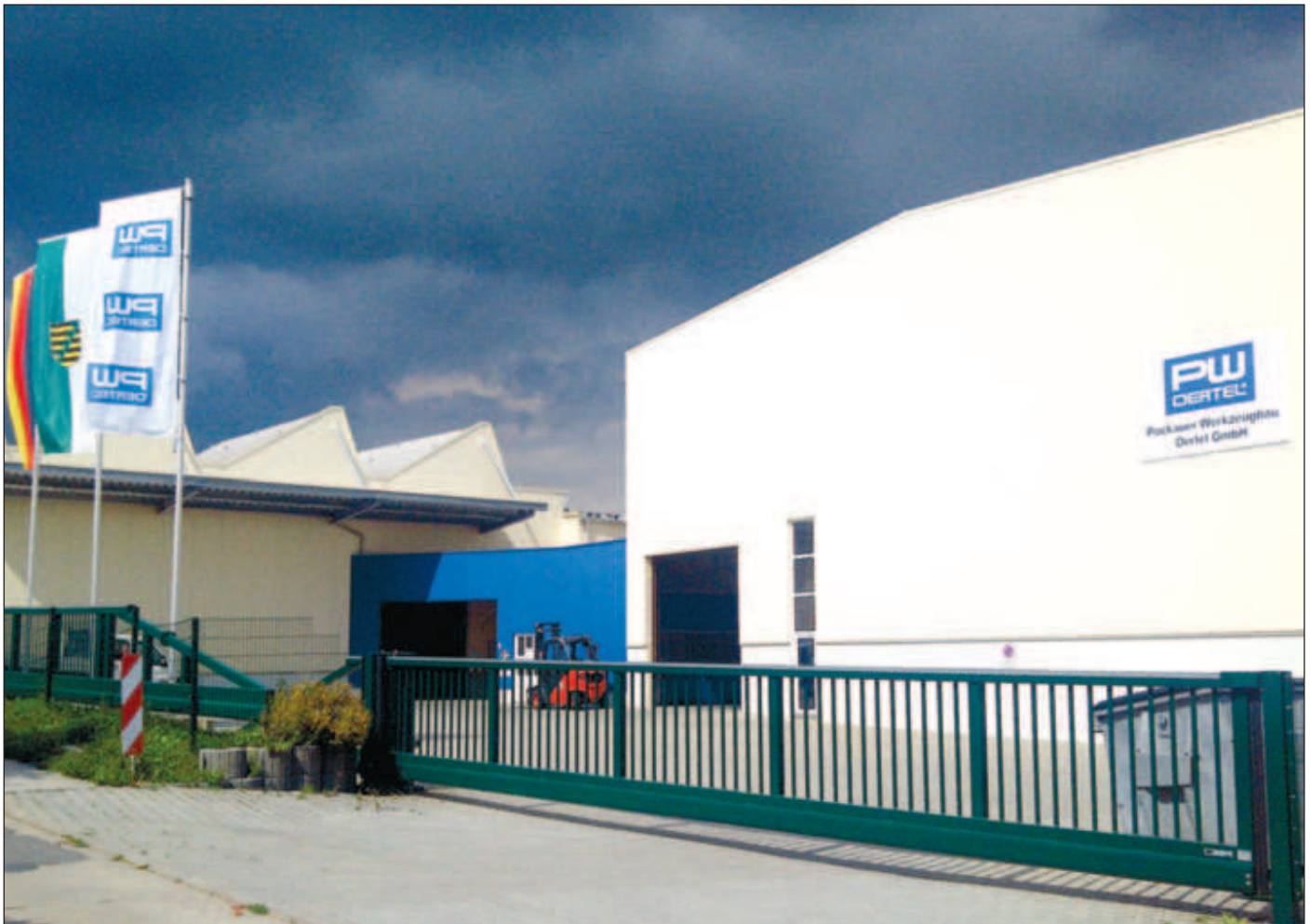
Die Firma Pockauer Werkzeugbau Oertel GmbH am Lengefelder Gewerbering - Die Werkhalle links im Bild ist in diesem Jahr neu errichtet worden.

■ Einschulung 2014 Anmeldetermine für Grundschule Lengefeld